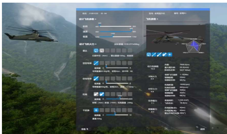
图 3 竞赛系统效果示意（性能设计）

飞行器概念设计与对抗赛以新一代武装直升机概念设计为背景，参赛队根据竞赛要求，完成武装直升机的性能参数(如图 3 所示)和概念方案设计，并将设计的概念飞行器带入到飞行器概念设计对抗仿真竞赛系统（简称：竞赛系统）进行对抗仿真任务验证(如图 4 所示)，包括人-机对抗和人-人对抗两种形式，涵盖典型对空和对地任务场景。