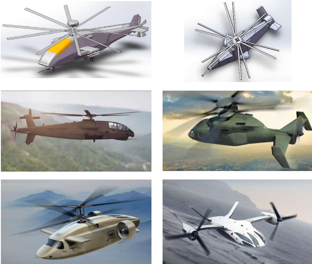
图 5 概念设计方案参考图