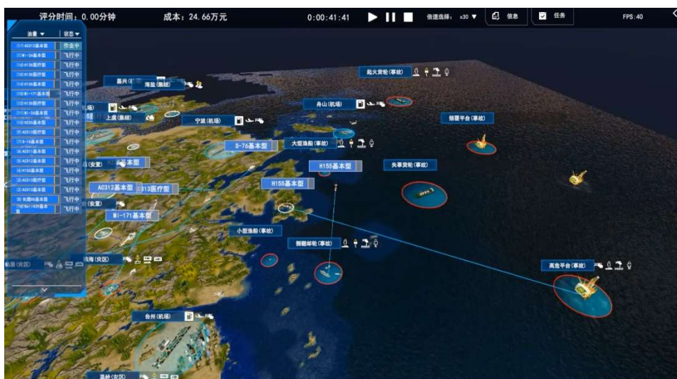
图 2 竞赛系统效果示意（推演仿真）