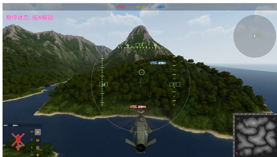
图 4 竞赛系统效果示意（对抗仿真）